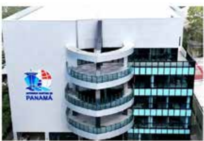
Panama como Estado de Soberanía regional, amena profundamente la calidad de vida, fomenta el País e inclusión. El Canal

Член на екипажа на кораб е убит, а други двама са ранени след атака с дрон срещу кораб, плаващ под флага на Панама в Черно море. Това съобщи Морската администрация на Панама /AMP/ на 19 юни, цитирана от Reuters и БТА, предаде bTV.