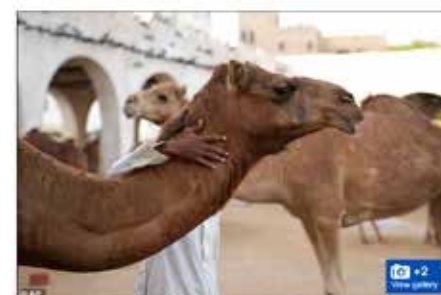
Twenty camels have been disqualified from a beauty pageant in Oman after they were found to have undergone cosmetic procedures (Stock image)

20 камили са дисквалифицирани от конкурс заради скандал с ботокс