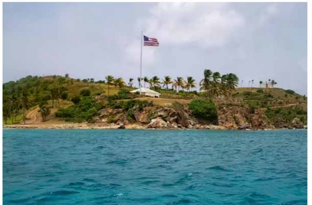
This photo taken in July 2019 shows a view of Little St. James Island in the U.S. Virgin Islands, a property owned by Jeffrey Epstein.

Далия Намян не работи, не консултира, не притежава акции и не получава финансиране от компания или организация, които биха могли да се възползват от тази статия, и не е разкрила връзки извън академичното си назначение.