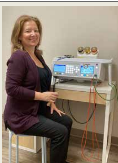
Krop BioResonance Studio

✓ Оптимизирайте. Психическото и физическо изтощение отслабва организма ни. Двигателят на клетките (митохондриите) се захранва от АТР. Изтощението лишава клетките ни от гориво. Биорезонансът проверява за енергийни средства, от които организмът ви се нуждае, за да оптимизира митохондриалната енергия.