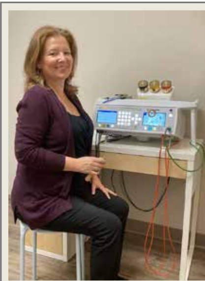
Krop BioResonance Studio

- Оптимизирайте. Психическото и физическо изтощение отслабва организма ни. Двигателят на клетките (митохондриите) се захранва от АТР. Изтощението лишава клетките ни от гориво. Биорезонансът проверява за енергийни средства, от които организмът ви се нуждае, за да оптимизира митохондриалната енергия.