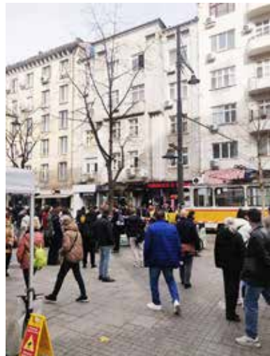
Екипът на „Бърза помощ“ е оказал на място помощ на

«Славейков на 12 ноември. От СДВР обясниха, че момичето е било на колело. Момичето първоначално е прието в противошокова зала на болница “Пирогов” и след това е настанено в детската неврохирургия.