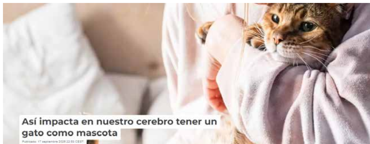
Así impacta en nuestro cerebro tener un gato como mascota

Автор: Лора Елин Пигот - Старши преподавател по неврология и неврорехабилитация, ръководител на курс в Колежа по здравеопазване и науки за живота, London South Bank University