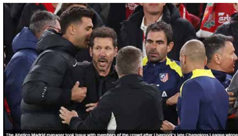
The Atletico Madrid manager took issue with members of the crowd after Liverpool's late Champions League winner

Диего Симеоне разкри защо е нападнал яростно феновете на Ливърпул след загубата на Атлетико с 2:3