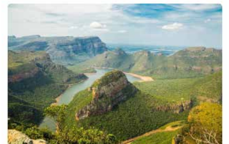
Blyde River Canyon – lush green valleys and a winding river amidst dramatic cliffs

Не казвам, че Южна Африка е малка, но е по-малка, отколкото изглежда. Въпреки огромните си 471,445 квадратни мили (1.2 милиона квадратни километра) – което я прави голяма колкото Франция и Испания взети заедно – тя е едва 9-та по големина държава на африканския континент. За сравнение, Алжир държи титлата на най-голямата държава на континента, почти два пъти по-голяма от Южна Африка.