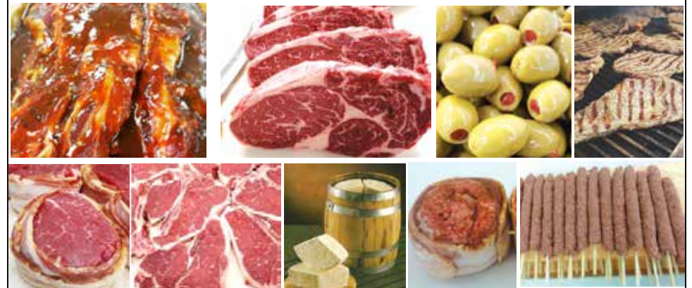
Най-вкусните "сувлаки" са при нас!