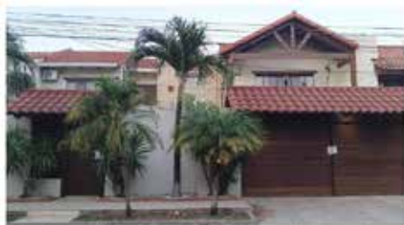
Un serbio y un búlgaro están entre las víctimas, mientras que hay un tercero cuya identidad aún no fue esclarecida por la Policía. Las pesquisas continúan y no se descarta implicación del narcotráfico.

Български гражданин на 43 г., 38-годишен сърбин и още един неидентифициран са били убити в дом в жилищен квартал на Санта Круз де ла Сиера в Боливия. Четирима заподозрени, всички боливийци, са арестувани и ще им бъдат повдигнати обвинения, след което ще се явят пред съдия, съобщава публикувания в Боливия EL DEBER.