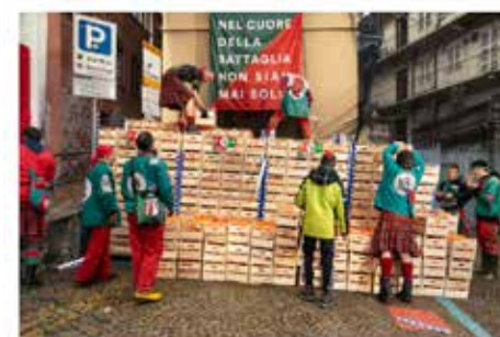
The Italian town prepares for the Battle of the Oranges in the historic Sogno neighborhood. The crowd gathers on the bank of the river to witness the symbol of Carnival's historic (and now) battle in Ivrea long ago.

Независимо дали бунтът срещу тирана и средновековната героиня е факт или измислица, жителите на Иври го празнуват по един и същи начин – дори всяка година избират съвременната Виолета. Представена на града в карнавалната събота, тя се появява по време на празненствата, хвърляйки бонбони и наблюдавайки празненствата. Обичаите обаче са се развили през вековете, като повечето от историческите елементи и традиции на фестивала са добавени по-късно, включително хвърлянето на портокали, което започва едва след Втората световна война.