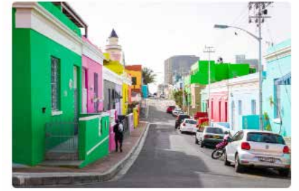
The colorful houses in Cape Town's Bo-Kaap symbolize the freedom and the end of slavery.

Vilakazi Street, разположена в Совето, Йоханесбург , е единствената улица в света, която е била дом на двама носители на Нобелова награда за мир: Нелсън Мандела и архиепископ Дезмънд Туту. Тази улица се превърна в символ на борбата за свобода и равенство в Южна Африка. И Мандела, и Туту са живели тук в различни периоди от живота си.