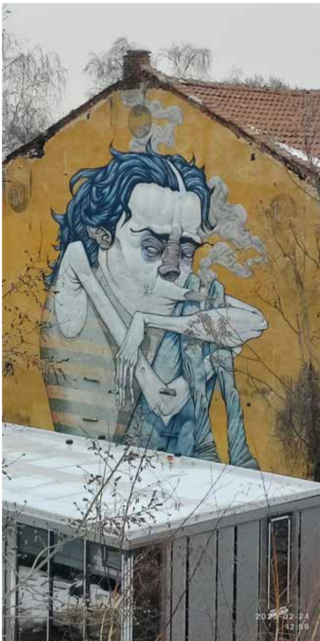
Не съм фен на графитите, но тази картина много ме впечатли и затова я снимах да ви я покажа. Ужасяващо потресяваща нали? Виждате ли ухото на дявола?

by Viara Dimitrova, Editor of Bulgarian Flame, PHOTOS © Bulgarian Flame