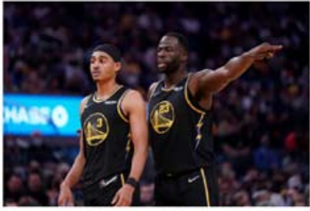
Golden State's Draymond Green, right, punched Jordan Poole, left, during a practice on Wednesday, but he has not said why. Green said he apologized to Poole and the team.

След като последните дни бяха изпълнени със спекулации около побоя между Дреймънд Грийн и Джордан Пуул по време на тренировка на „Голдън Стейт Уориърс“, сега се появили кадри от инцидента във видео,