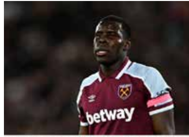
Kurt Zouma continued to play for West Ham following the incident but was fined £250,000 and was dropped by his sponsor Adidas

на видеото да казва: „Кълна се, че ще го убия, кълна се, че ще го убия“.