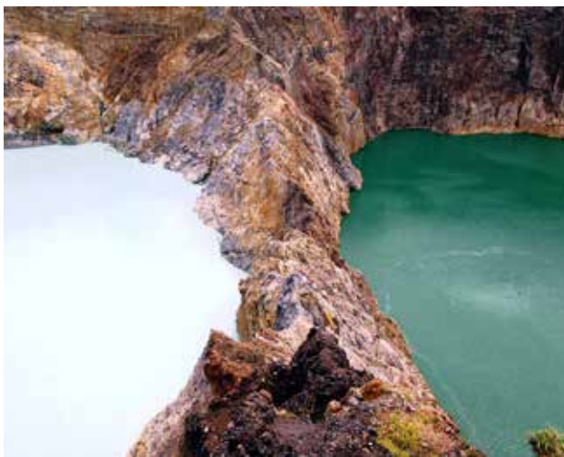
Вулкан и езера Кели Муту – о. Флорес, Индонезия

Слизането по пустия криволичещ път в началото е приятно и весело и минава в снимки и анекдоти, докато не се задават следобедните облаци и замислят компанията.