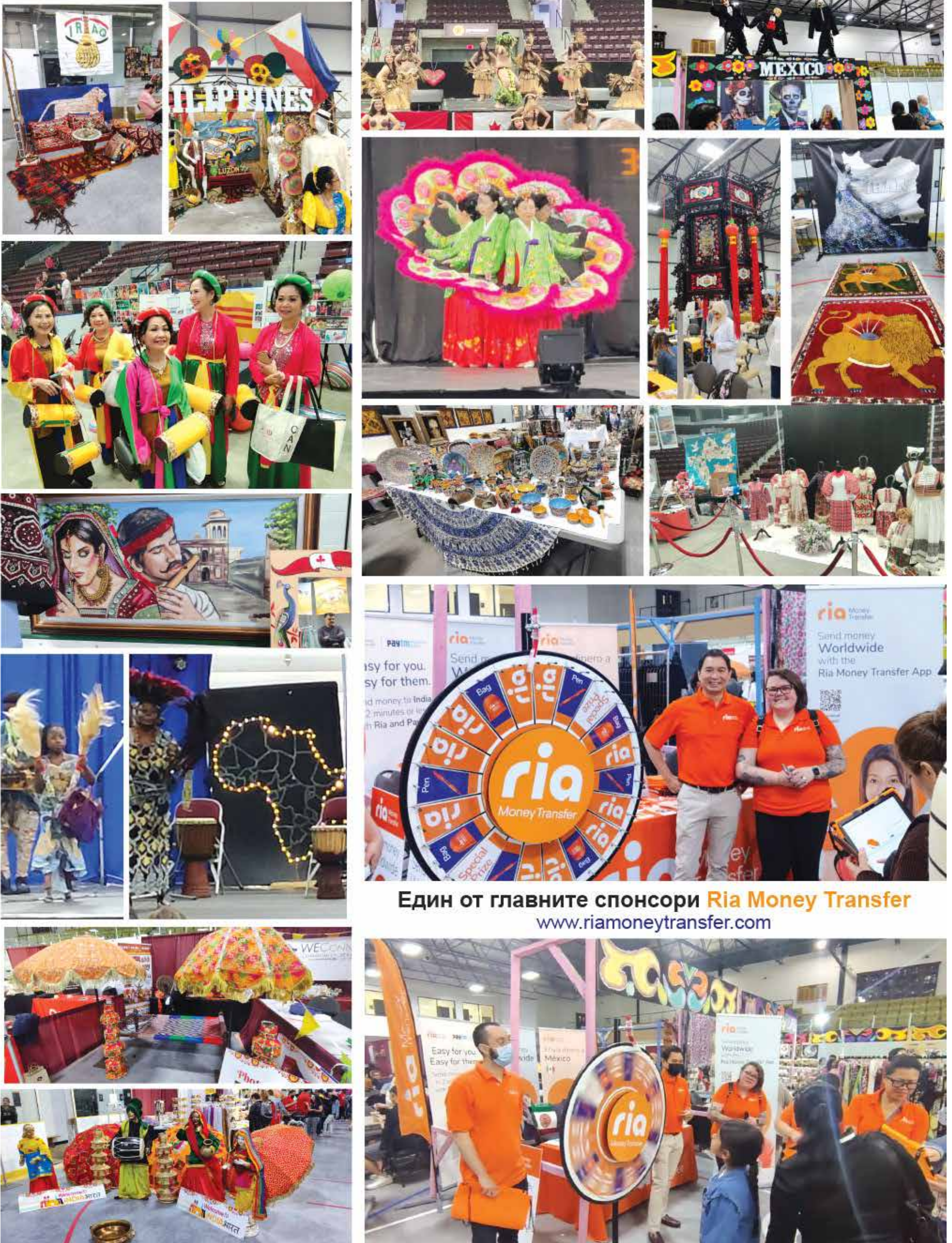
Един от главните спонсори Ria Money Transfer www.riamoneytransfer.com