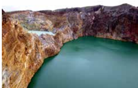
Вулкан и езера Кели Муту