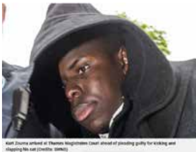
Kurt Zouma arrived at Thames Magistrates Court ahead of pleading guilty for kicking and slapping his cat

Футболистът на „Уест Хем“ Кърт Зума се призна за виновен за насилие над котката си