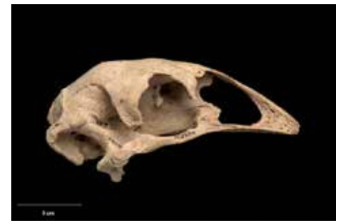
Skull of an eastern moa. Skeletal information can be obtained from non-invasive scans after thousands of years. To Page 02

Източните моа изчезват поради прекомерен лов и унищожаване на местообитанията им от хората и вероятно поради хищничество на kuī (кучета) и kiore (плъхове). Но процъфтявали ли са популациите на Източните моа, когато хората са пристигнали, или вече са били в беда поради древното изменение на климата?