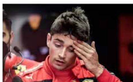
The red Ferrari was leading in the race when the driver struck the 27-year-old driver

Леклерк е пред наказание, след като Ferrari предостави данни за двигателя