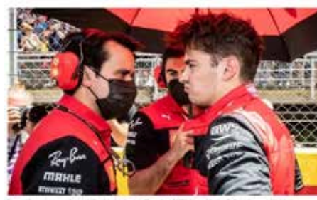
Charles Leclerc (left) and Max Verstappen (right) in the pit stop during the race

След като Макс Верстапен записа последователни победи в Имола и Маями, Леклерк искаше да отвърне с модернизирания на своя F1-75. Но в 27-та обиколка колата на Леклерк се забави точно поради проблем с турбото. Неговият холандски съперник се възползва безмилостно, за да изгради преднина от шест точки пред Леклерк, а тима на Ред Бул също да поведе в шампионата на конструкторите.