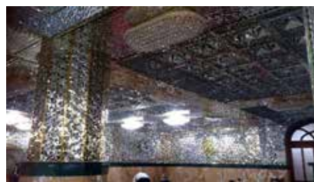
Огледална джамия (Джамията Мир Момсун Ага)

Другите забележителности, които посетихме на връщане от Узбекистан бяха на север – Горещата планина Янардаг, Атешгах – Зороастрийско светилище с непрекъснато горящи огънове и Джамията Мир Момсун Ага – един сравнително млад светец, /роден 1890 г./, която отвътре е цялата в огледални апликации, нещо, което може да се види в Иран.