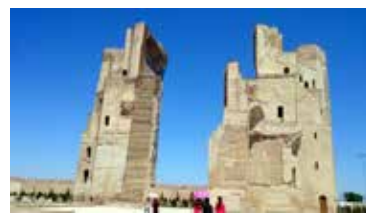
Шахризабз – родния град на Тимур

От Самарканд направихме еднодневен излет до Шахризабз – родния град на Тимур.