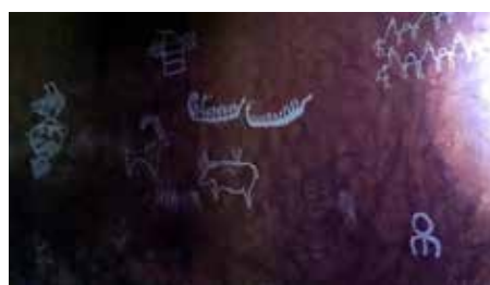
Губистан – прочут със скалните си рисунки

В Баку си бяхме наели апартамент, какъвто всеки би искал да има. Бяхме си уговорили и кола, с която да посетим Губистан – прочут със скалните си рисунки