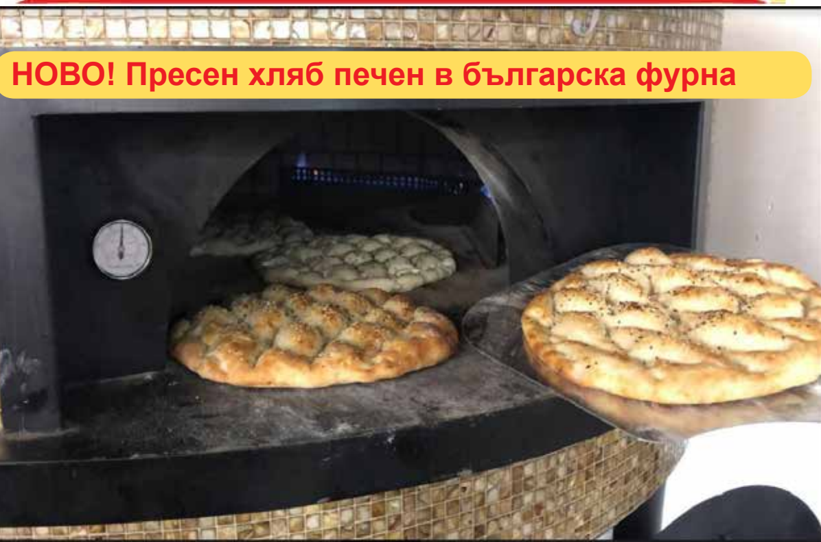
НОВО! Пресен хляб печен в българска фурна