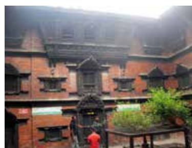
Терасата, където се появява живата богиня Кумари

А на площад Дурбар в Катманду успяхме да видим живата богиня Кумари, но не я снимахме тъй като това е строго забранено.