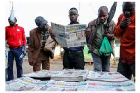
Journalists find the missing Americans among a list of names linked to Pandora Papers. Journalists looking through lists of names to identify more than 100 names and former offshore shell companies as part of the Pandora Papers.

Те може да не са толкова богати, колкото клиентите си, но получават милиони, за да скрият трилиони.