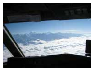
Поглед към Еверест