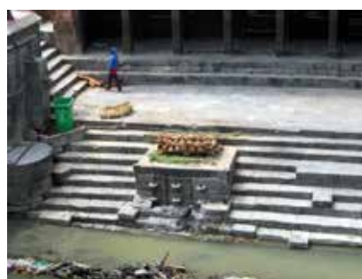
Кладата е готова

разбира се от почти всички местни бири, разгледахме комплекса в Патан, посетихме Сваямбхунат /Храмът на маймуните/, Буданат и Пашупатинат. В последния храмов комплекс наблюдавахме как непалците изгарят на кладите своите мъртви.