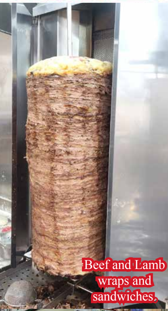
Beef and Lamb wraps and sandwiches.