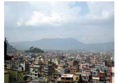
Гледката от хотела

се настанихме. Най-обикновена двойна стая със собствен санитарен възел. Електричеството прекъсваше от време на време, но иначе всичко останало беше приемливо. На покрива на хотела имаше маси и столове, а изгледът беше невероятен.