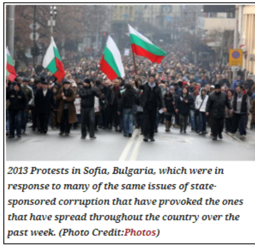
2013 Protests in Sofia, Bulgaria, which were in response to many of the same issues of state-sponsored corruption that have provoked the ones that have spread throughout the country over the past week.

Докато протестите в цялата страна продължават, общественото възмущение относно финансираната от държавата служба за сигурност изглежда само върхът на айсберга. „Напрежението нараства през последните няколко месеца откакто Иван Гешев, противоречива фигура, стана главен прокурор“, каза Бечев. Възходът на Гешев, който стана главен прокурор на България през ноември 2019, се случва след като той направи поредица от публични изявления, оневиняващи Пеевски