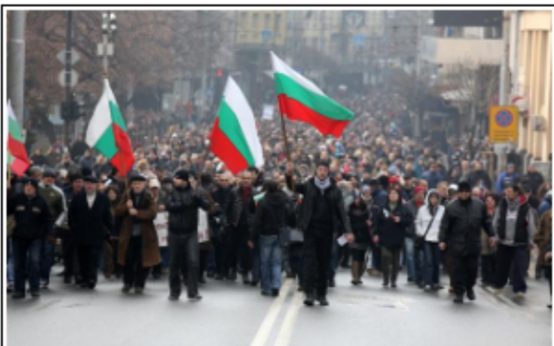
2013 Protests in Sofia, Bulgaria, which were in response to many of the same issues of state-sponsored corruption that have provoked the ones that have spread throughout the country over the past week.

Автор: ELI MOSKOWITZ – репортер в The Organized Crime and Corruption Reporting Project .